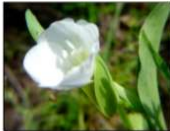
b. Detalle de la flor