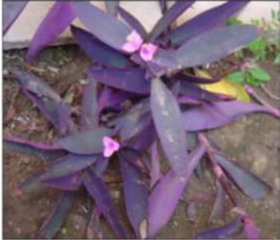
a. Aspecto general de la