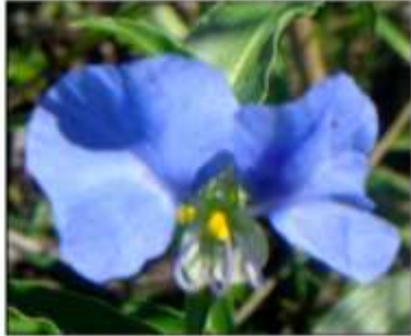
a. Detalle de la flor