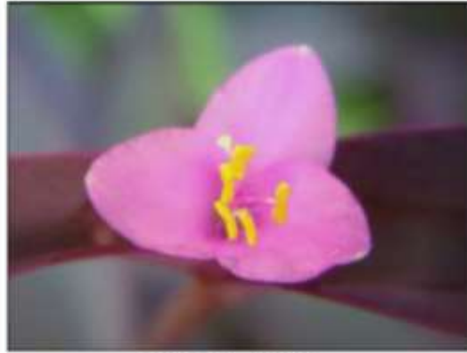
b. Detalle de la flor