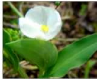
c. Detalle de la espata