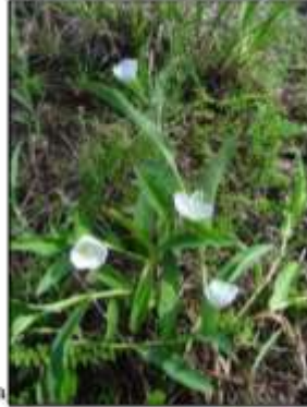
a. Aspecto general de la planta